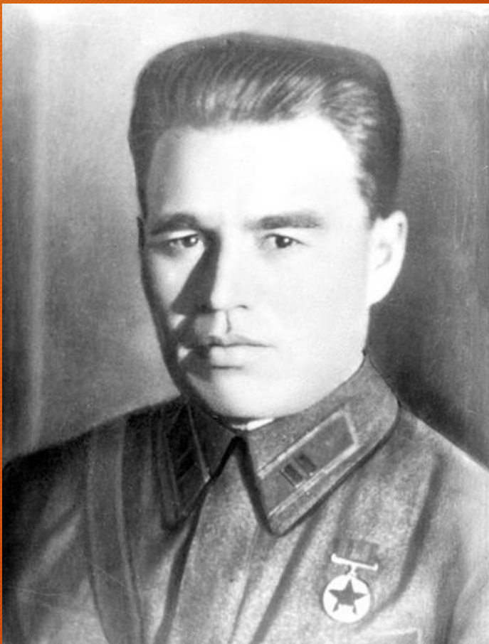
Майор П.М. Гаврилов

Одно из первых сражений Великой Отечественной войны.