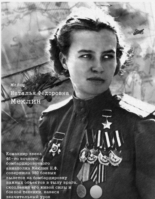
Майор Наталья Федоровна Меклин

Командир звена 46-го ночного бомбардировочного авиационного полка Меклин Н.Ф. совершила 980 боевых вылетов на бомбардировку важных объектов в тылу врага, скопления его живой силы и боевой техники, нанеся значительный урон гитлеровцам.