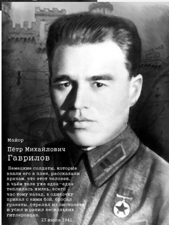
Майор Пётр Михайлович Гаврилов